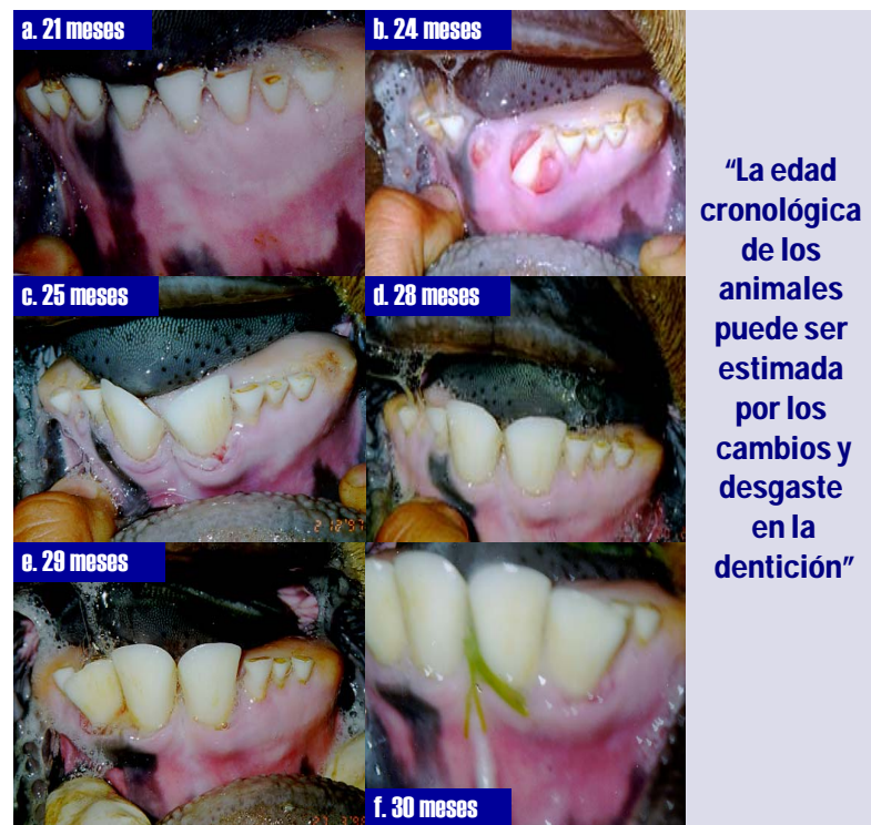
Figura 1. Reemplazo de los incisivos centrales en el maxilar inferior de un torete cruza Cebú x Holstein entre los 21 y 30 meses de edad.