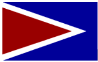
Escudo de Cabo Rojo

Cognomento: Mata con Hacha, Cuna de Betances.