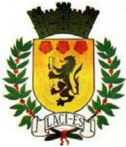
Escudo de Ciales