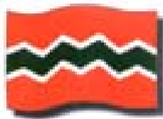
Bandera de Jayuya