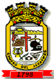
Escudo de Juana Díaz