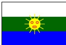
Bandera de Las Piedras