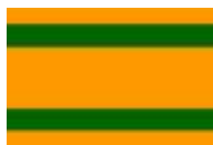
Bandera de Naranjito