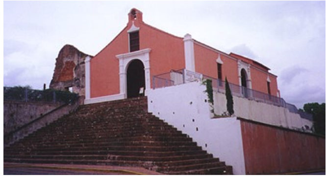
Porta Coeli se pronuncia "Porta Cheli" y significa "Puerta del Cielo"

Construida entre los años 1606 y 1607 se cree que es la iglesia más antigua de Puerto Rico que aun está en pie. La ermita era parte de un convento construido por los Frailes Dominicos con donativos de los vecinos de la Villa. En en el siglo 19 el convento se utilizó además como escuela y se pretendió usar también como cárcel, cosa que no pudo ser por oponerse los habitantes del pueblo. En 1868 y debido a su mal estado, se derribó el convento (excepto una parte de la pared frontal) quedando sólo la ermita. Originalmente el campanario, junto con una cruz, estaba en el edificio del convento y no en la ermita, y el techo de área del altar era más bajo que el de la nave central, lo contrario que en la actualidad. El campanario ha debido colocarse en el lugar que está hoy entre 1878 y 1920. En 1949 la Iglesia Católica cedió el edificio al Gobierno Estatal para convertirlo (1962) en Museo de Arte Religioso y como tal funciona ahora tras varias restauraciones. En 1930 la Junta Conservadora de Valores Históricos, primera organización de conservación del gobierno insular, incluyó al Porta Coeli como monumento histórico. El Porta Coeli también está incluido en el Registro Nacional de Lugares Históricos de los Estados Unidos.