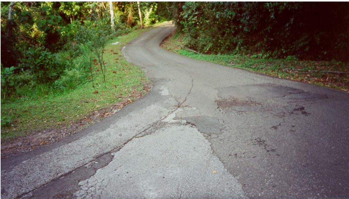
Camino Los Ramos