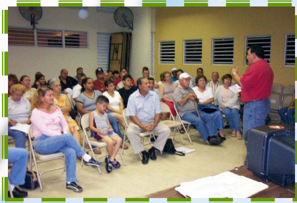
Asamblea del CPDCM