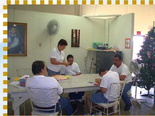
Cientes de AMPI en taller de manualidades