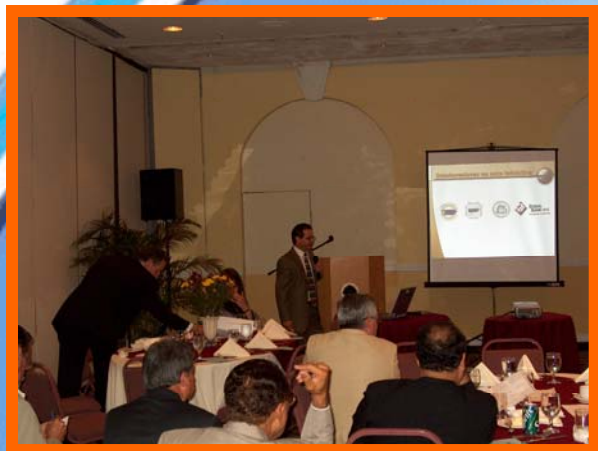
Presentación del folleto “Western Region at a Glance 2005, Investor’s Information Booklet” a los socios y Junta de Directores de la CCOPR