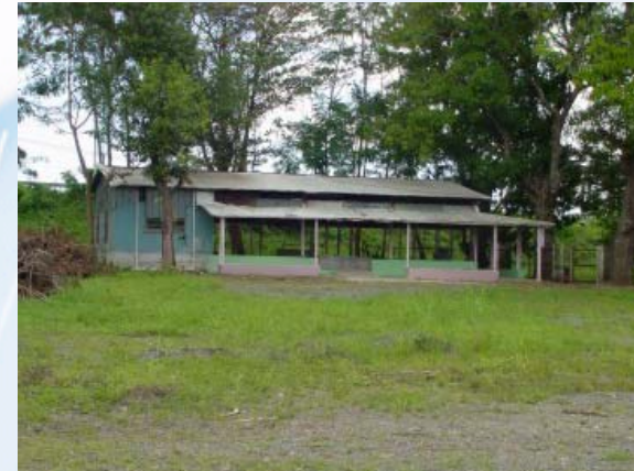
Antiguo Club de Actividades