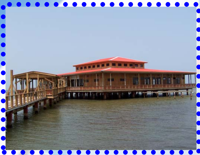
Muelle de los Franceses