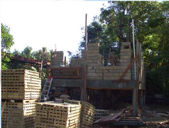
Construcción de viviendas