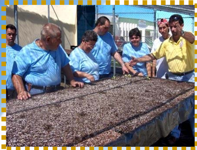
Proyecto de Horticultura