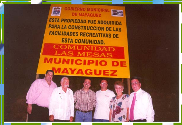
Primera piedra para el Centro de Servicios Múltiples