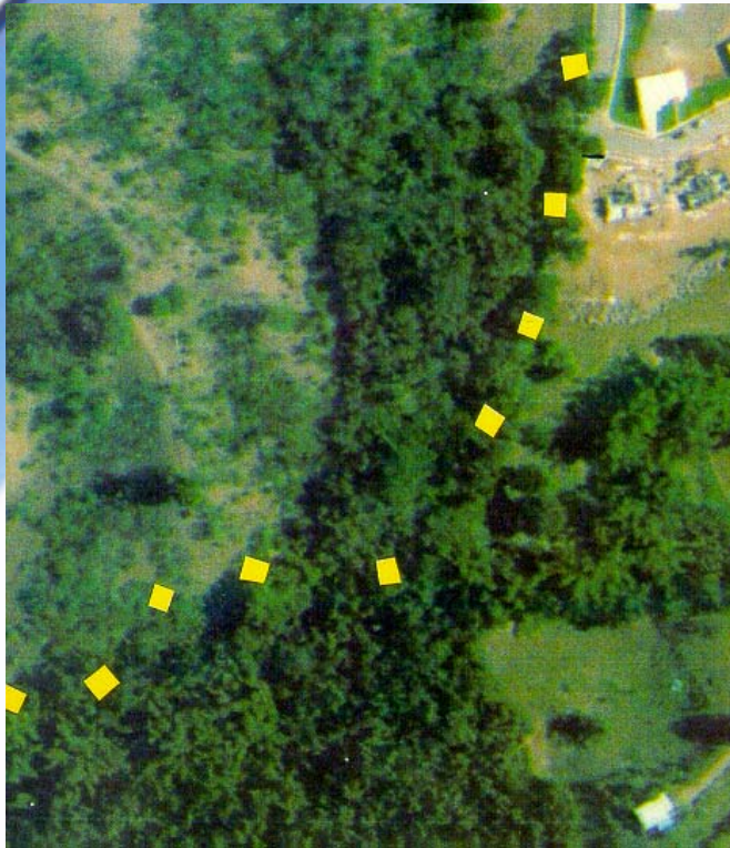
Foto aérea de la ubicación de los terrenos para proyecto de vivienda