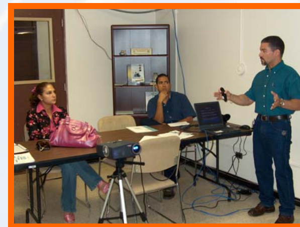
Presentación del CRINC