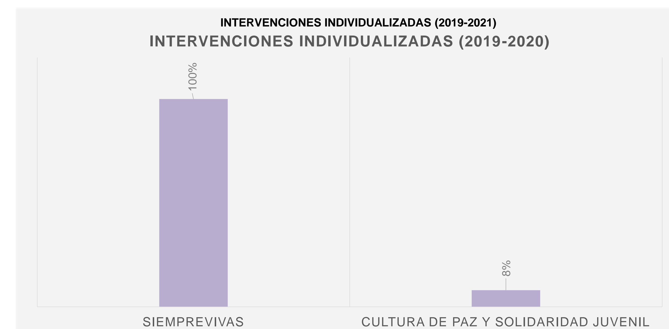
Figura 3. Intervenciones individualizadas (2019-2020). Porcentaje de participantes que recibieron intervenciones individualizadas durante 2019-2020, incluyendo seguimiento individual, acompañamiento legal, apoyo emocional e información/referidos.