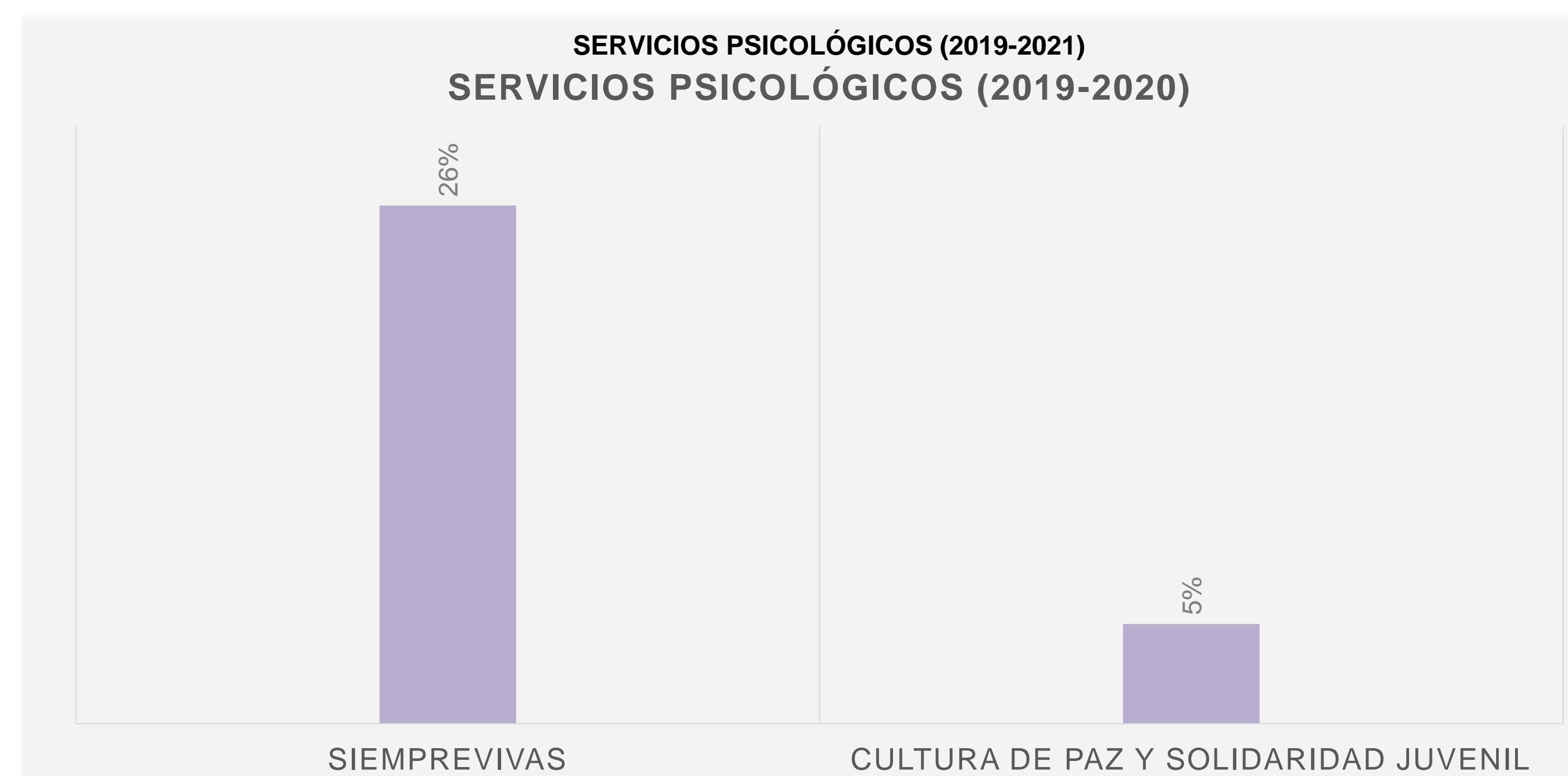
Figura 2. Servicios psicológicos (2019-2020). Porcentaje de participantes que recibieron servicios psicológicos provistos por el Proyecto SIEMPRE VIVAS durante 2019-2020.