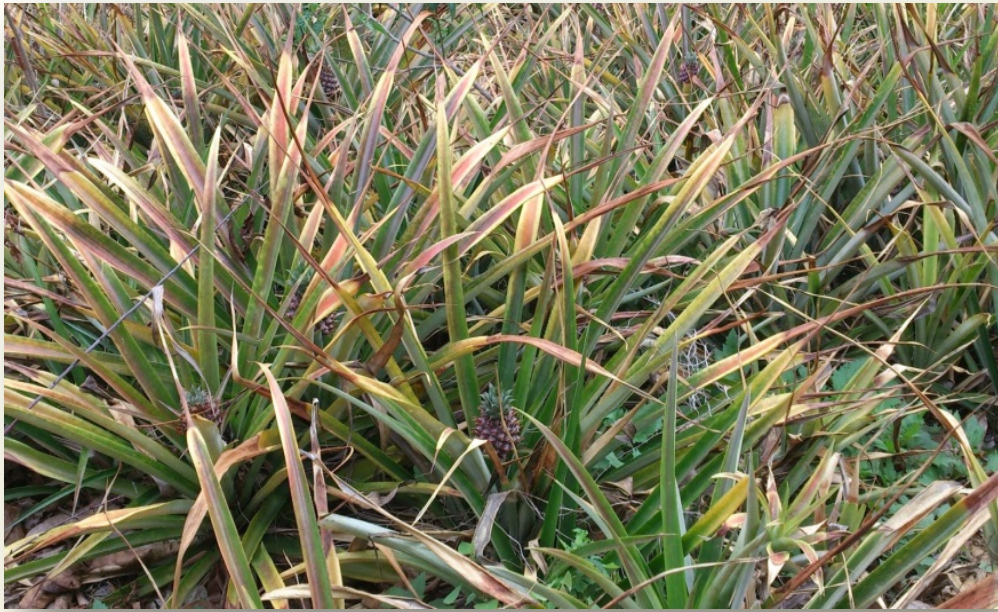
Siembra de piña afectadas por Marchitez Roja. http://ppcontest01.blogspot.com/2014/06/1.html