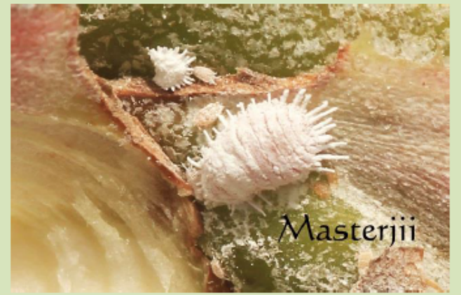
La chinche harinosa se localiza en las axilas inferiores de las plantas, las raíces, tallos, puntos de crecimiento. Algunas pueden introducirse dentro de las flores y reducir la calidad del fruto.