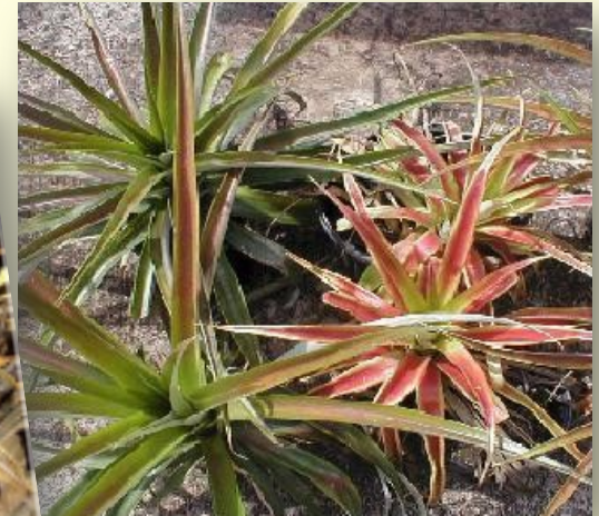
(a) Síntomas típicos de marchitez roja en piña española roja. Lily Eng-senasica.gob.mx . (b) Enrojecimiento de las hojas viejas y enrollamiento de los bordes. García et.al. 2012 .