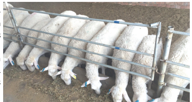
Los sistemas intensivos se caracterizan por la utilización de raciones completas en base a granos y el confinamiento de los animales

Desde el punto de vista de manejo reproductivo, se procura tener la mayor eficiencia (5 ó más partos en 3 años por oveja) y una mortalidad mínima, ya sea su propósito la obtención de pie de cría o de corderos para el engorde. Es común el empleo de prácticas como la inseminación artificial por laparoscopia, la ovulación múltiple, la sincronización de celo, la transferencia de embriones, la fertilización in vitro, el uso de marcadores genéticos y la detección de preñez por ecografía.