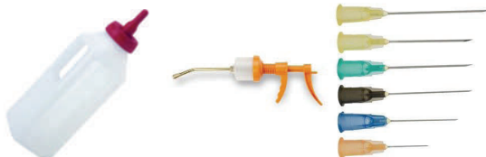
Ilustración de algunos materiales necesarios para un botiquín de salud general en fincas de ovinos, de izquierda a derecha; lanza botella para sustituto de leche, jeringuilla dosificadora de cristal y agujas de diferente largo y grosor.

Recuerde que la cría es el producto del trabajo de muchos meses de esfuerzo, desde el período de empadronamiento hasta el parto y su muerte resulta en pérdidas económicas.