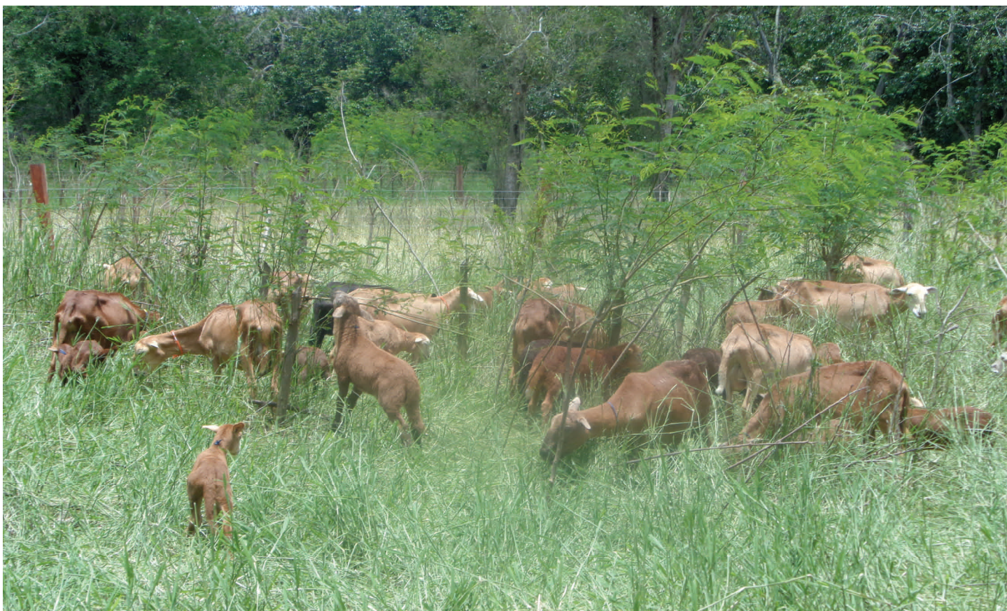
Crianza de ovinos de pelo en un sistema silvopastoril de gramíneas tropicales y Leucaena leucocephala

Unos de los SSPI más recomendados son los basados en la utilización de Leucaena leucocephala Lam (de Wit), conocida como zarcillo en Puerto Rico. Es una leguminosa arbórea que no posee espinas, puede llegar a ser un árbol que mide hasta 20 mts de altura, pero por lo general se utiliza en SSPI cuando su altura es menor a tres metros. Esta leguminosa se caracteriza por tener hojas bipinadas, flores blancas en capítulo, vainas alargadas, delgadas y aplastadas y por lo general rectas. El valor de Leucaena leucocephala también reside en su carácter multipropósito, su crecimiento rápido, y su facilidad de propagación y manejo por parte de los agricultores. Se describe a menudo como la "alfalfa de los trópicos", y fue la primera especie utilizada para la producción de abono verde en sistemas de cultivo en callejones. Además, y dado su alto contenido de nutrientes (especialmente el de proteína bruta) y su alta proporción hoja:tallo, la Leucaena leucocephala Lam, sirve como alimento de excelente calidad.