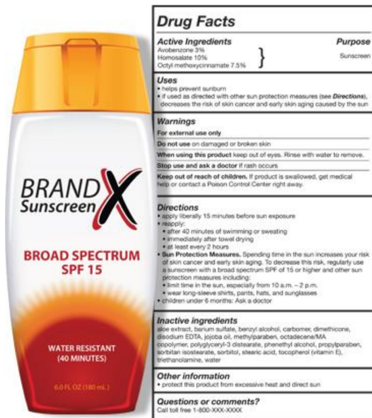
Figura 2. Información que debe tener la etiqueta de un filtro solar según la Administración de Drogas y Alimentos (FDA).

La Figura 2 presenta la información detallada de los ingredientes e información que debe contener un filtro solar en la etiqueta de acuerdo a las guías de la FDA: