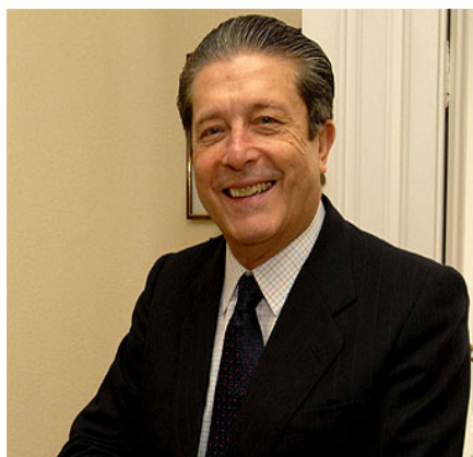
Dr. Federico Mayor Zaragoza (1934 – 2024) Por: Dra. Maylene Cotto Andino

Federico Mayor Zaragoza (Barcelona, 27 de enero de 1934 – Madrid, 19 de diciembre de 2024) fue farmacéutico, profesor, poeta, político y funcionario internacional español, quien ganó notoriedad por ser ministro de Educación y Ciencia de España entre 1981 y 1982 y director general de la UNESCO durante doce años, entre 1987 y 1999.