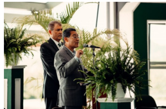
*Fotos tomadas de la prensa y de: https://www.uprm.edu/economia/fotos50aniversario/