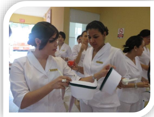
ESTUDIANTES PREPARÁNDOSE PARA LA CEREMONIA DE INICIACIÓN A LA PROFESIÓN