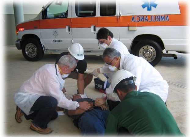
Actividades de Simulación