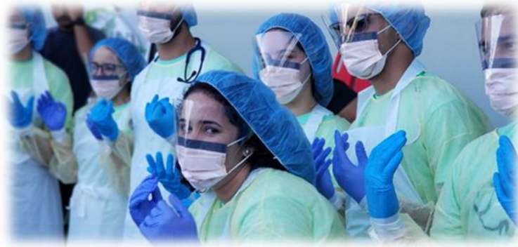
Actividad de Reclutamiento