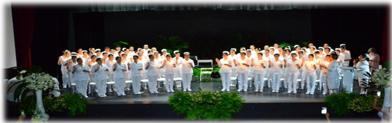
CEREMONIA DE INICIACIÓN A LA PROFESIÓN