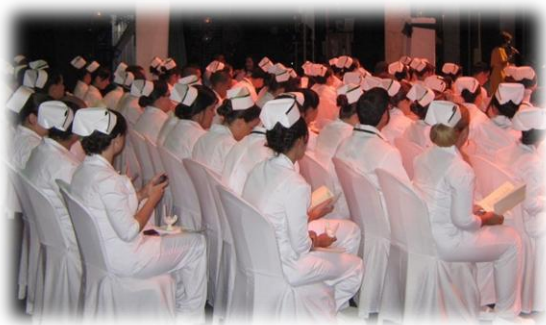
Ceremonia del Capping

LOS GRADUADOS SON RESPONSABLES DE SU DESARROLLO CONTINUO PROFESIONAL Y PERSONAL Y ESTÁN ALERTAS A LOS CAMBIOS DINÁMICOS Y TENDENCIAS EN LA PRÁCTICA DE ENFERMERÍA PROFESIONAL. SON CIUDADANOS RESPONSABLES, RESPETUOSOS Y HONORABLES EN SU COMPROMISO HACIA LA PROFESIÓN Y LA SOCIEDAD. ESTOS POSEEN LOS REQUISITOS MÍNIMOS NECESARIOS PARA SOLICITAR EL EXAMEN DE REVÁLIDA DE LA JUNTA EXAMINADORA DE ENFERMERÍA DE PUERTO RICO Y EL CONCILIO NACIONAL DE JUNTAS DE ENFERMERÍA DE LOS ESTADOS UNIDOS.