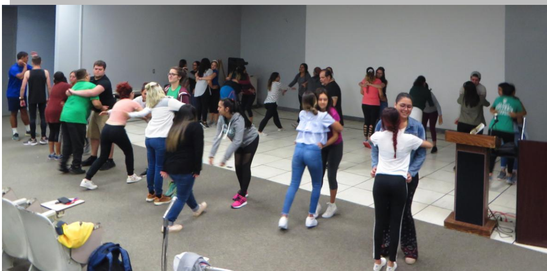
Estudiantes del curso de ENFE 3045: Enfermería Psiquiátrica tomando el curso de Defensa Personal con fuerza no letal.