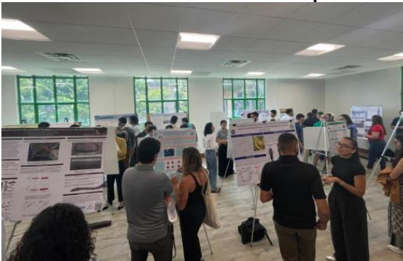
Sesión de Afiches