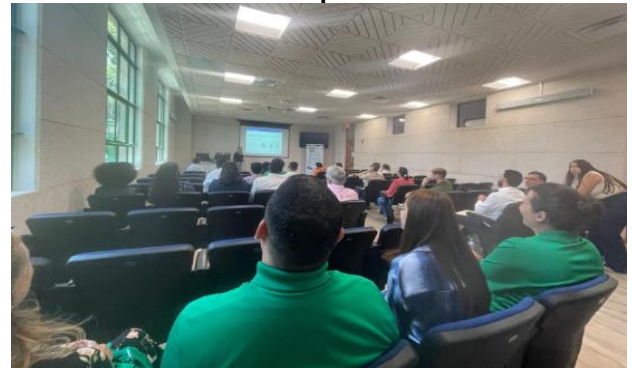
Sesión de Presentaciones Orales