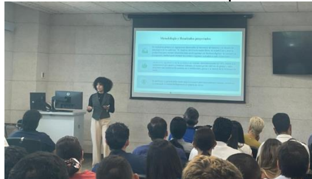
Sesión de Propuestas Flash