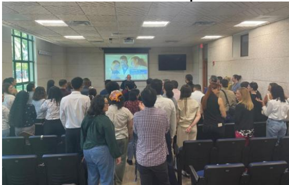
Actividad del Orador Principal