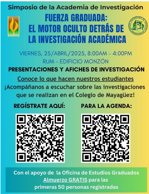
Promoción del Simposio