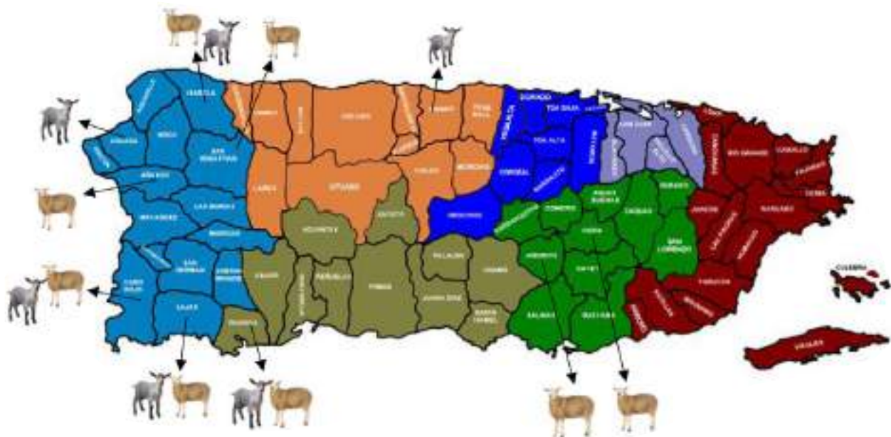
Figura 1. Localización por municipio de las fincas de rumiantes pequeños participantes

La información general incluyó preguntas sobre los objetivos de la finca, el sistema de producción, la raza y cantidad de