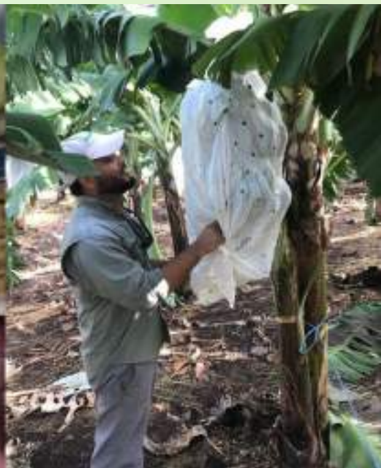
Mancha roja causada por el trípido Chaetanaphotrips signipennis en guineo, muestreo del trípido y técnica de embolsado del racimo.