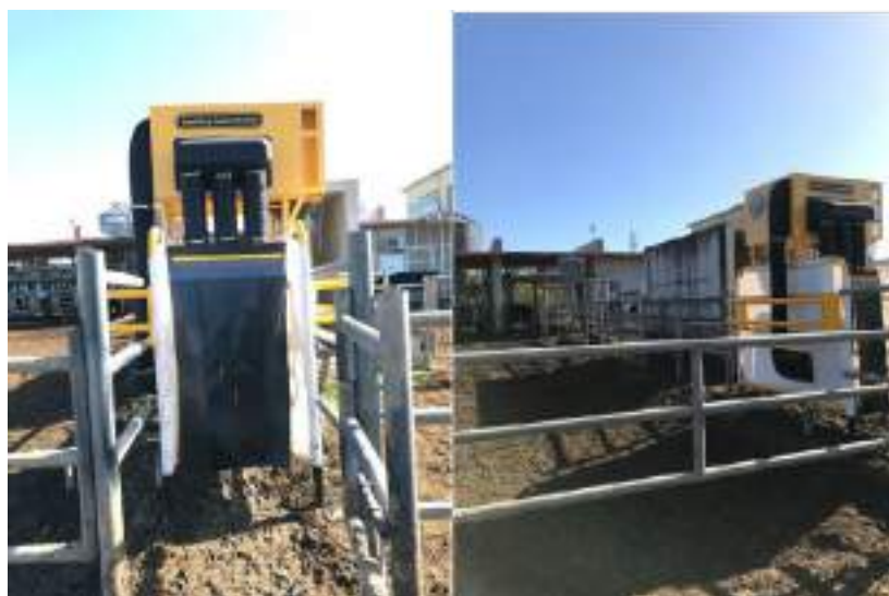
Máquina para atrapar moscas instalada en granja comercial de ganado lechero.