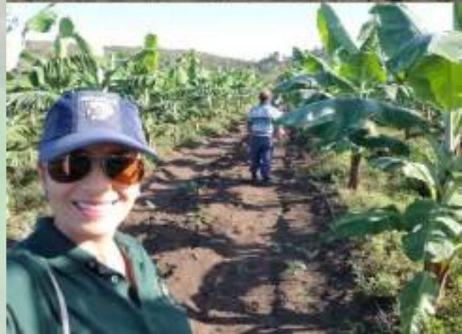
Predio demostrativo para estudio del trípido de la mancha roja del guineo en Guánica, P.R.