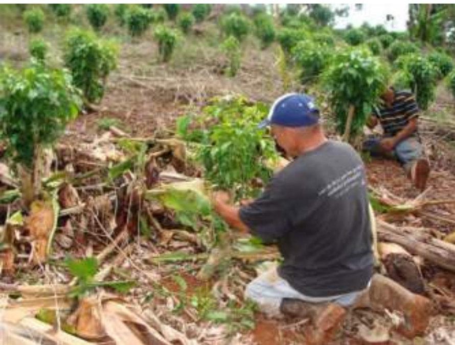
Figura 2. Deschuponando el café

Otro aspecto importante, meses después, luego de realizar la poda de renovación, es el manejo de los chupones. Debe dejar que los chupones hayan crecido unas 18 a 24 pulgadas de altura. Dentro de los chupones que hayan crecido, deben seleccionar los 3 más vigorosos que queden a lados opuestos uno del otro.