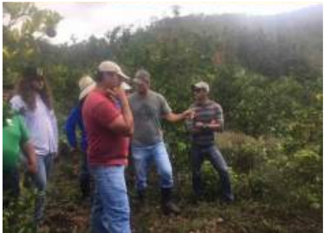
Día de campo sobre “Citrus greening” para agricultores y agrónomos y en extrema superior derecha, el uso de un dron para evaluar la incidencia de la enfermedad en el predio.