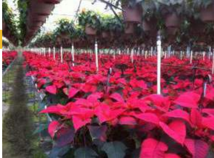
Vivero de pascuas en Aibonito y cuestionario desarrollado para conocer las prácticas de MIP de los productores de pascuas.