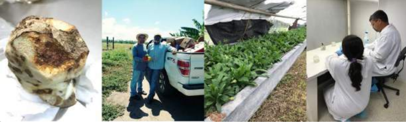
Visitas a fincas de hortalizas, raíces y tubérculos y plátano y guineo. Entrenamiento de agricultores en producción de semilla mediante cultivo de tejido.

en la identificación de plagas y enfermedades y prácticas de MIP que se deben implementar en las fincas. Está en proceso el establecimiento de una nueva clínica de diagnóstico de Extensión en la Estación Experimental Agrícola de Río Piedras para dar apoyo a los agricultores de la región noreste y central de la Isla. Se desarrolló una encuesta para conocer cuánto saben los agricultores sobre MIP, identificación y cómo recolectar muestras para su identificación en la clínica de diagnóstico. Se ha mejorado el contacto con la clientela a través de consultas por la aplicación de WhatsApp y la página de Facebook de la Clínica de Diagnóstico del SEA, http://facebook.com/clinicauprm/ . Se produjeron tres boletines informativos para ayudar a los agricultores y a los agentes agrícolas sobre cómo recolectar muestras, reconocimiento de síntomas y prácticas de manejo.