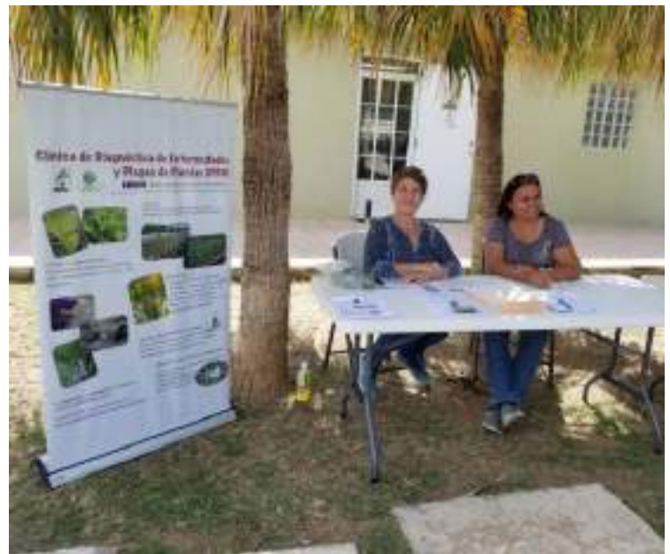
Presentación en la Reunión de la Empresa de Farináceos sobre Clínica de Diagnóstico y Protocolo para importación de guineo y plátano a Puerto Rico; exhibición de la Clínica de Diagnóstico en la reunión de la Empresa de Hortalizas.