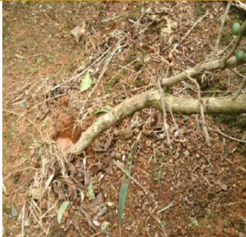
Figura 1. Café piloneado

Si quedó parte de la plantación en pie en algunas áreas de la finca, no corte los arbustos rápidamente. Luego del evento de huracán se tarda alrededor 4 a 5 años para tener una siembra nueva con buena producción. En el caso de las variedades de porte bajo podría comenzar a producir a los 3 años, pero no serán las cosechas con más abundancia. Por tal razón es importante tratar de recuperar los arbustos que se hayan quedado en pie en la finca. En el caso de arbustos que hayan quedado piloneados o acostados, deben realizar lo siguiente: