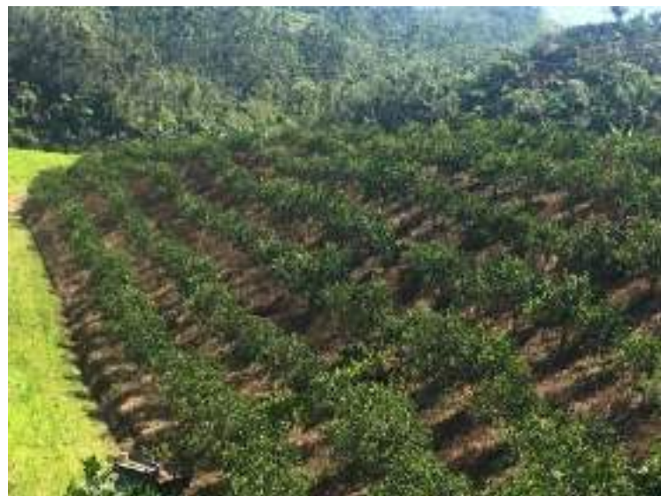
Predio demostrativo de “Citrus greening” en Las Marías.

prácticas de manejo innovadoras en siembras afectadas por esta enfermedad. Como parte del proyecto, se evaluará la incidencia de la enfermedad mediante el uso de un dron con espectro infrarrojo. Se distribuyó una publicación sobre manejo nutricional a agricultores y agrónomos. Durante el próximo año, se mantendrá informados a los agricultores y demás clientela a través de una revista digital y días de campo donde se capacitará a los agricultores en las prácticas llevadas a cabo en el predio demostrativo.